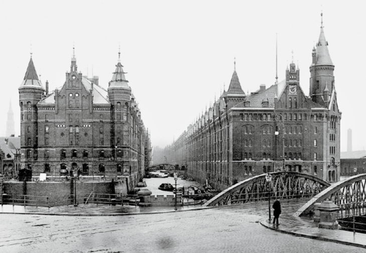
SPEICHERSTADT/NIEDERBAUMBRÜCKE UM 1890