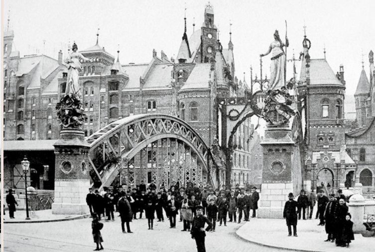
IN ERWARTUNG DES KAISERS/29. OKTOBER 1888