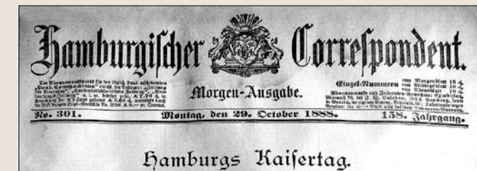
Hamburgischer Correspondent, Montag, den 29. October 1888

Die SPEICHERSTADT STORY fasst die verfügbaren Quellen zu einem spannenden Dokumentarstück zusammen. Die Geschichte wird nicht nacherzählt, sie erzählt sich selbst: Direkt, bunt, kontrovers und sehr, sehr hamburgisch.